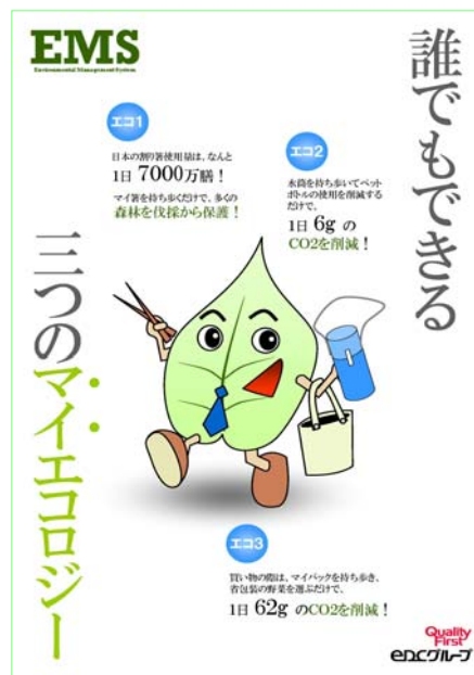
キャンペーン・ポスター：「三つのマイエコロジー」

社員一人ひとりが業務上だけでなく、日常においても環境にやさしい生活を推進するべく「マイはし・マイボトル・マイバッグキャンペーン」を展開しています。